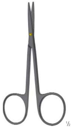
Delicate dissecting scissors Feine Präparierschere