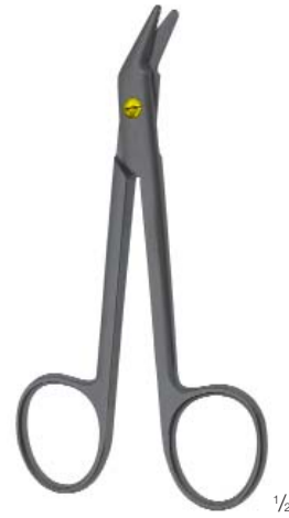
UNIVERSAL 120 mm