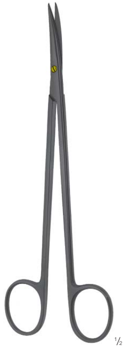
METZENBAUM FINO 1/2