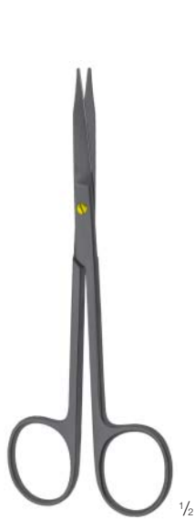
CERAMO® TC GOLDMANN-FOX