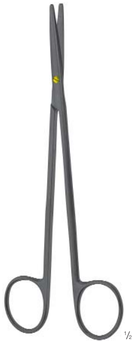
METZENBAUM FINO 1/2