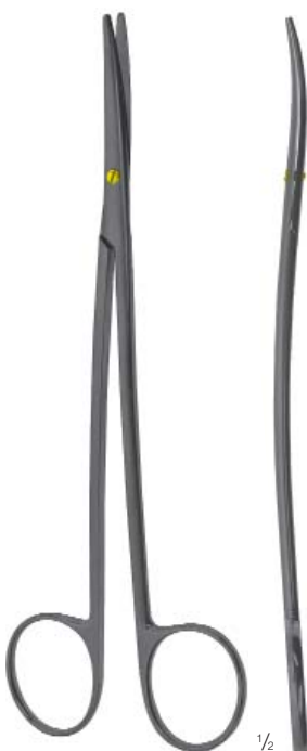
METZENBAUM FINO 1/2