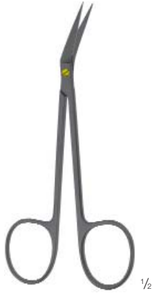
DELICATE, ANGLED FEIN, GEWINKELT 115 mm