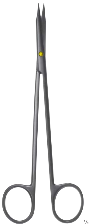
CERAMO® TC STEVENS/REYNOLDS