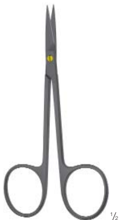
Delicate dissecting scissors Feine Präparierschere